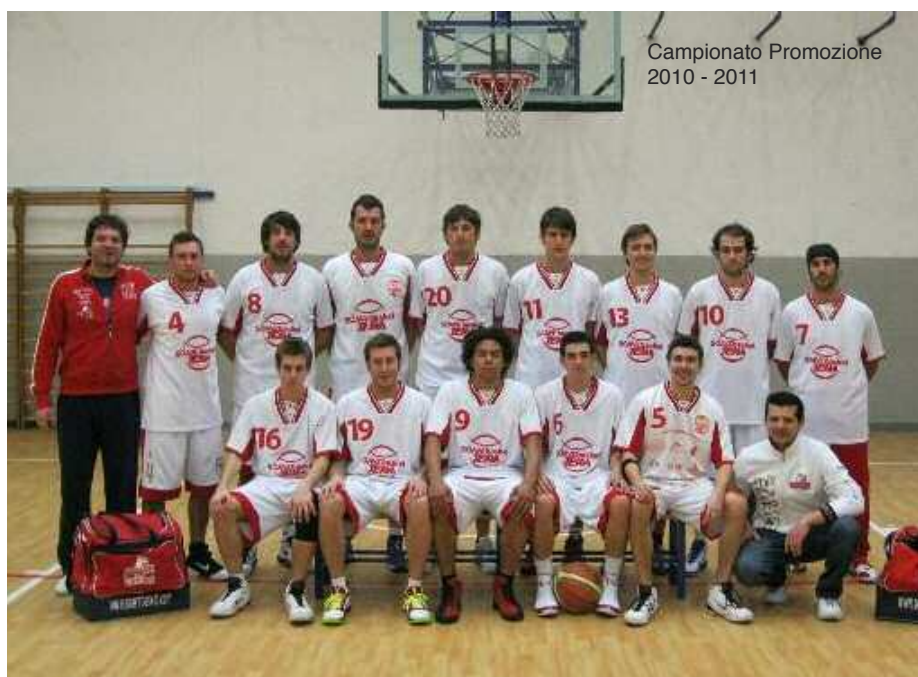
Campionato Promozione 2010 - 2011