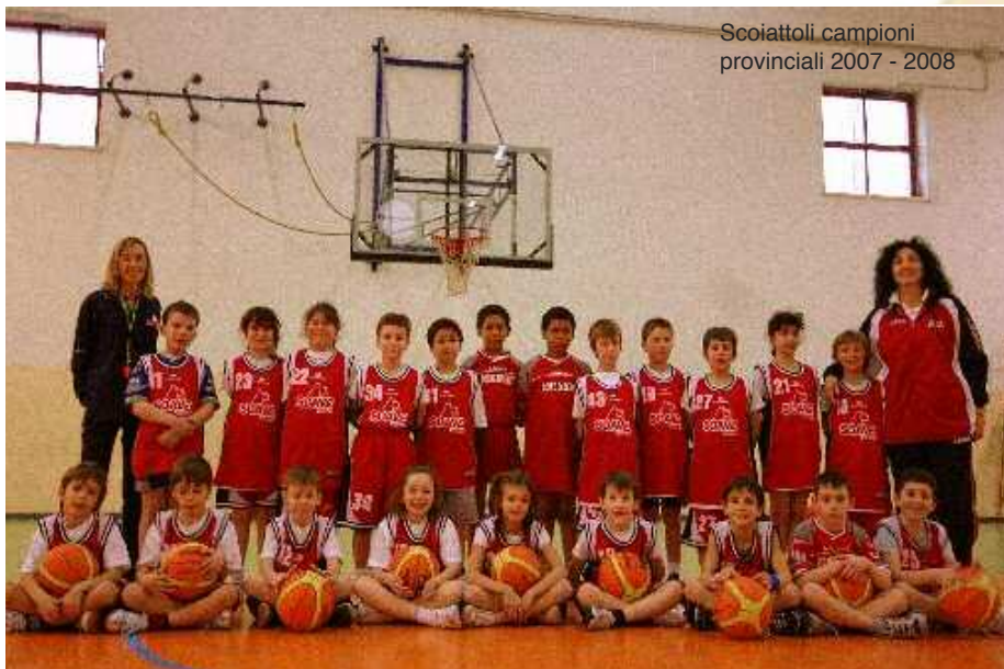
Scoiattoli campioni provinciali 2007 - 2008